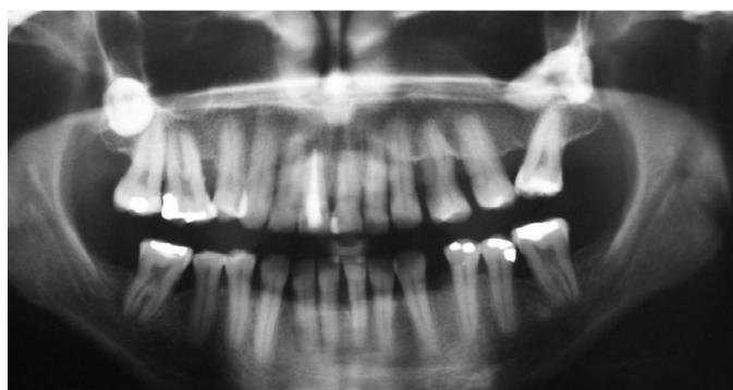
Figura 2 - Pré-molares supranumerários